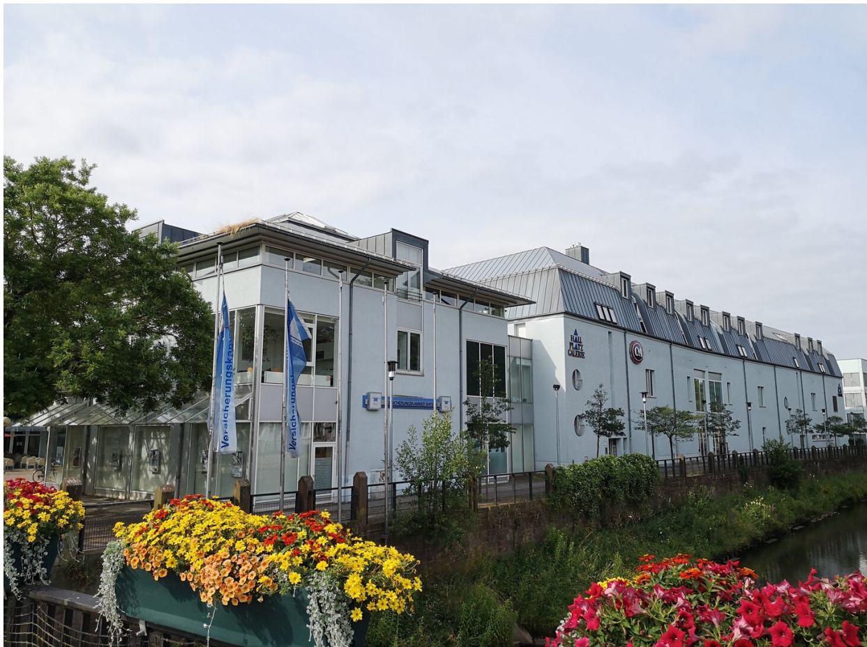
Hallplatz Galerie Zweibrücken.